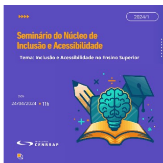
Post de Divulgação do Evento

O Núcleo de Inclusão e Acessibilidade promoveu em conjunto com o Núcleo de Apoio ao Docente e Discente (NADD) com o propósito de contribuir para a mudança de mentalidade e do comportamento de alunos e professores-tutores, propoveu em 2024 mais uma edição do Seminário do Núcleo de Inclusão e Acessibilidade. O evento realizado no dia 24 de abril de 2024, teve como tema: Inclusão e Acessibilidade no Ensino Superior, e contou com a participação da comunidade acadêmica.